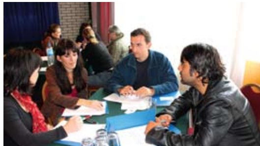
Преку вежбите, учесниците тестираа како би изгледала конкретната примена на Законот