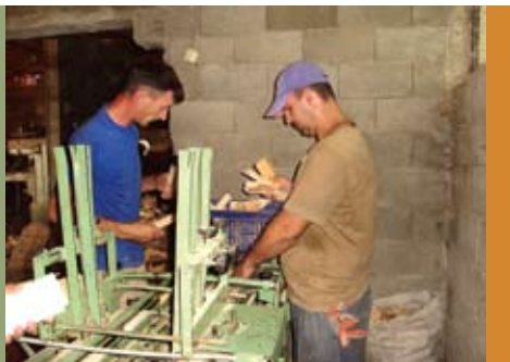
Пиланата Вистони во Босилово поддржана од кредитната линија на МРФП

МРФП ги прослави 10-те години од своето основање. Беше организирана прослава на која во присуство на донатори, соработници, партнери и претставници на деловниот и државниот сектор беа презентирани постигнувањата, како и идните планови на МРФП. За таа цел беше публикувана и монографија насловена како „10 години МРФП“