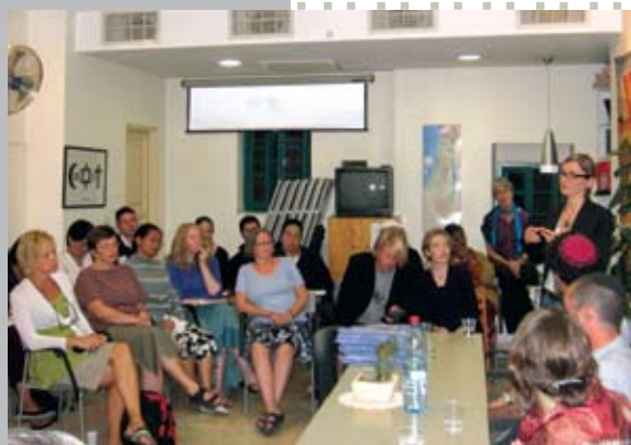
Средба во Swedish Christian Study Center со претставници на организациите на Breaking the silence, Rabbies For Peace и B'etsleem.

Организацијата настојува ја запознае Израелската јавност преку пишување и издавање на сведоштва на поранешните Израелски војници за нивните постапки во окупираната територија. Иако окупираната територија е на само 10 минути од Ерусалим, израелското население не оди таму и не знае каква е состојбата.