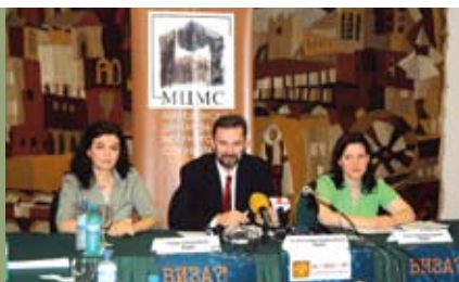
Почетокот на набљудувањето на визното олеснување беше најавен со прес конференција

Гарантното писмо било обезбедено од нивните деца кои работат и живеат во Германија со години. Домаќинот објаснил дека е вработен и дека е во можност да обезбеди доказ за тоа за потребите на амбасадата. Нивната апликација за виза била држена седум дена кога биле информирани дека е одбиена. И покрај барањето за објаснување на причините за одбивање, не им биле дадени информации и наместо тоа биле испратени со зборовите: „ова патување не е неопходно и нема што да барате таму“.