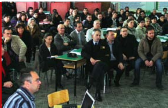
Од првата форумска сесија во Битола