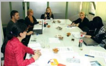
Состанок на работната група на МБД за Законот за заштита од дискриминација

Сојузот и понатаму ќе го следи процесот на донесување на Закон за заштита од дискриминација и ќе се обидува да придонесе во подобрувањето на законските решенија.