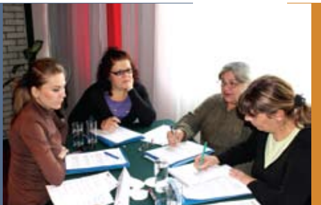
Учесниците во групи ги разработуваа случаите на дискриминација