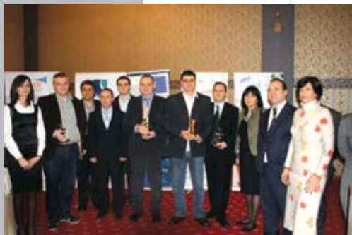
МРФП беше еден од организаторите на „Претприемачот на годината“